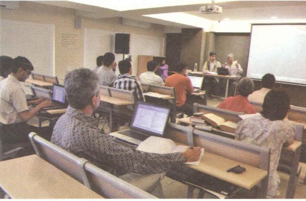
‘ધ અધર સોના’માં વિદ્યાર્થીને જટિલ કેસ સમજાવવા નિષ્ણાતો હાજર હોય છે.